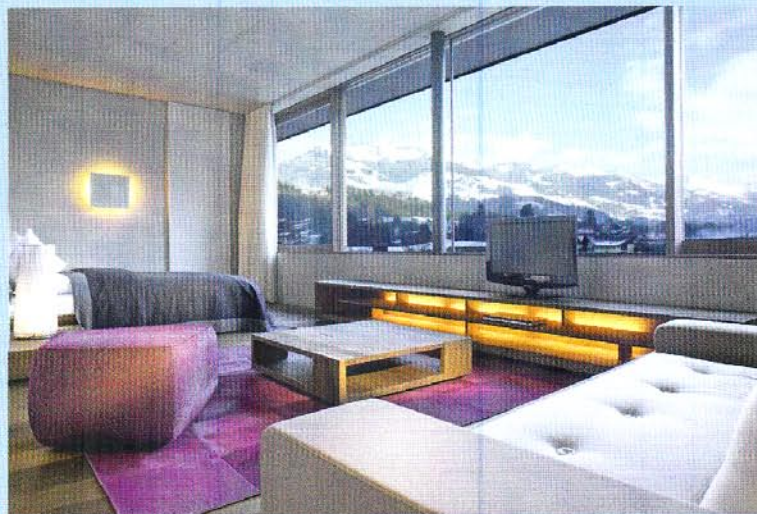
Exquisiter Lifestyle mit Alpenblick.

Eine Wellnesslandschaft über drei Stockwerke erfüllt alle Träume. Ein großer Pool und ein modernes Fitnesszentrum ergänzen das schon großzügige Angebot. Der Schwarze Adler zeigt sich eindrucksvoll als Lifestyle-Hotel der Superlative.