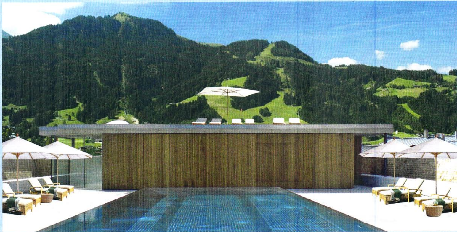
Modernste SPA-Anlage und Dachpool laden zum Entspannen ein.